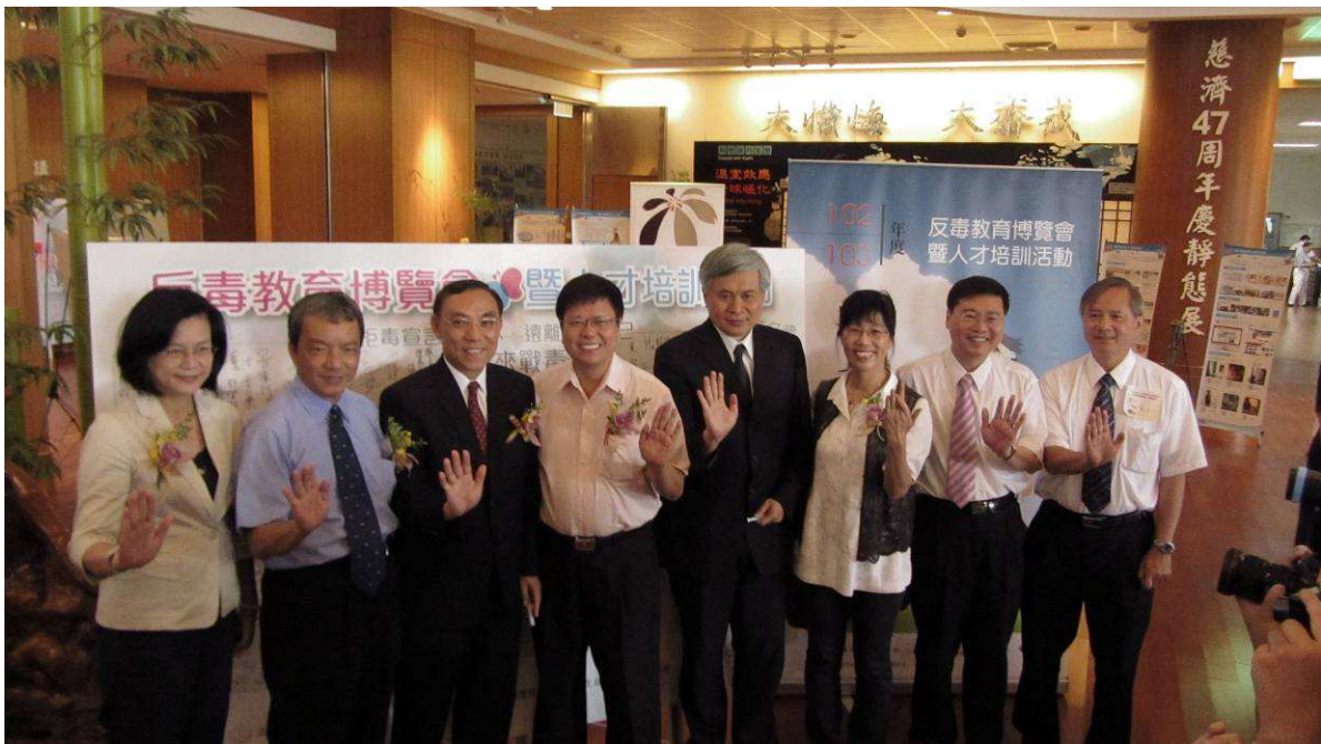
下圖： 反毒宣誓儀式

請尊重智慧財產權，如需引用或節錄者請與我們連絡。對於內容有任何指教，請將您的寶貴意見以電子郵件寄送至 moj506@mail.moj.gov.tw 。