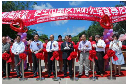
上圖：市集剪彩儀式