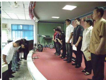
右圖：學員敬禮拜師學藝