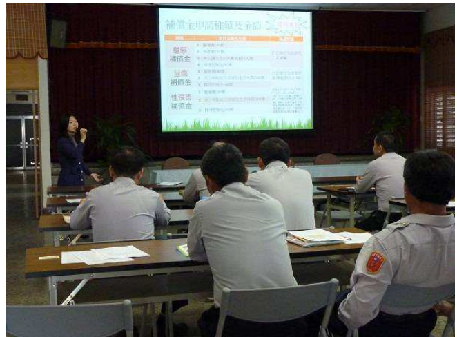
臺東縣警局臺東分局(左圖)及大武分局(右圖)聯繫會報剪影

請尊重智慧財產權，如需引用或節錄者請與我們連絡。對於內容有任何指教，請將您的寶貴意見以電子郵件寄送至 moj506@mail.moj.gov.tw 。