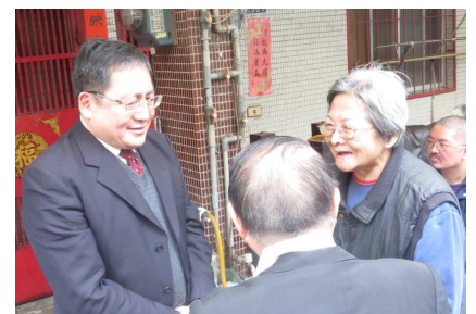
下圖：涂檢察長慰問獨居長者。