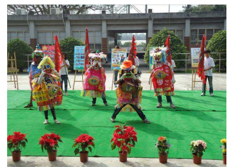
大平國小傳統舞獅表演。

種肯定與展現，程主任表示社區生活營的舉辦讓學生找到學業外的第二專長或特殊興趣，讓學生們從中找到自己的才能，獲得自我肯定與價值感，而針對的參加對象多為弱勢家庭高關懷學生，提供其學習不同專長與才藝，也展現了該署公益關懷弱勢學生的柔性司法核心價值。