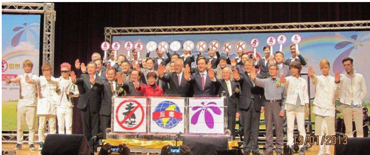
上圖：吳副總統帶領與會人員反毒宣誓