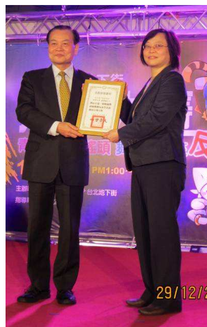
曾部長代表致贈感謝狀