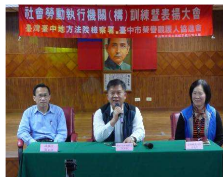
社會勞動執行機關(構)代表座談