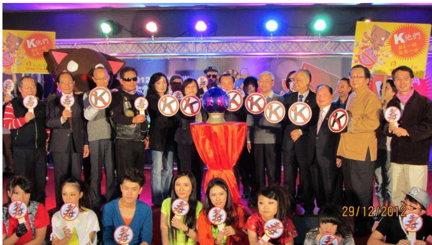
「啟動反毒街舞大賽活動」儀式

曾勇夫部長則進一步強調：許多藥頭故意傳播「K他命不是毒品，吸食不違法，也不會影響健康」等錯誤訊息來誤導青少年，事實上K他命是列管三級毒品，雖然給予青少年的吸食者從寬機會，但仍有處罰。長期吸食K他命會嚴重危害身心健康，不但會使膀胱容量減縮，讓人廁所跑不停，許多年輕人甚至終身依賴尿布過生活，記憶力也因吸食K他命而衰退，影響生活能力，曾勇夫部長特別呼籲全體民眾一定要拒絕毒品，追求健康，過快樂生活。