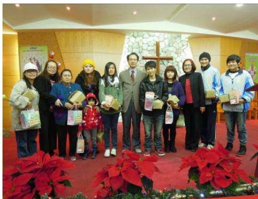
朱家崎檢察長參與禮拜與宣講

經過一系列的活動設計，司法與部落的距離逐漸縮短，族人親身感受新竹地檢署的善意與關心，對於犯罪預防宣導的接受度增加，司法零距離的目標也越加趨近。