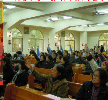
結合教會活動辦理反酒駕宣導