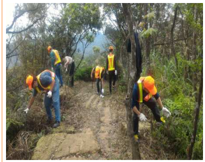
圖 3：「善用社會勞動人力，點燃復育鐘萼木生態希望」。