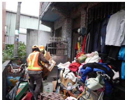
圖 4：「社勞伸援手—扶助弱勢家庭」。