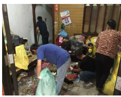
圖 5：「社勞敬老獻溫情—全盲奶奶足感心」。