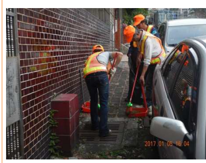
圖 6：「風災無情擾海濱—社勞齊心建家園」。