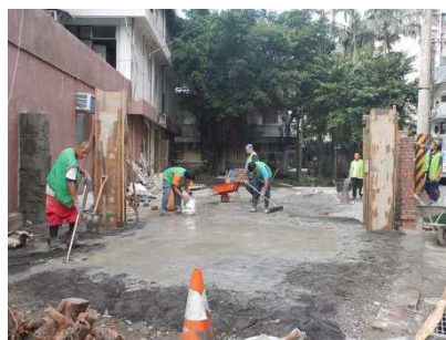
圖 7：「善用社勞省公帑—精心規劃頻獲獎」。