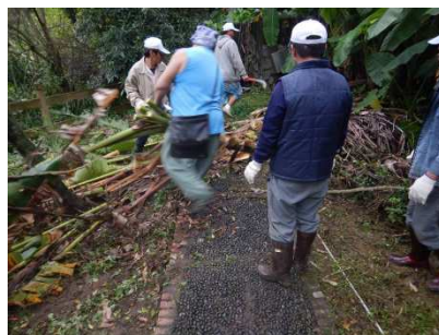
圖 8：「社勞著力嵌腳—生態教育展新猷」。