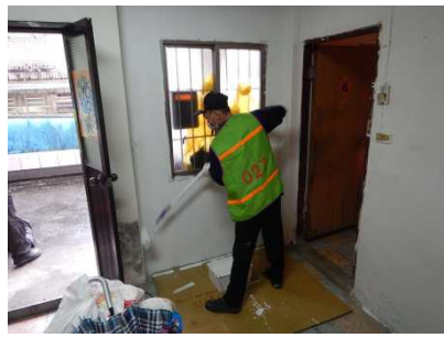
圖 1：「社勞伊甸獻愛心—家園清潔又溫馨」。