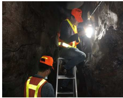
圖 2：「社勞人協助打造在地美景，佛手洞再現昔日風華」。