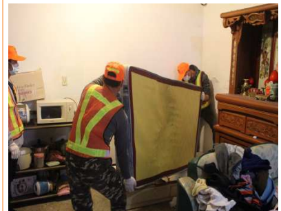
圖 9：「社勞喜布新，溫馨關懷過好年」：