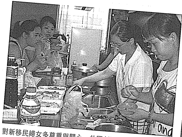
對新移民婦女多尊重與關心，共同創造多元共榮的社會