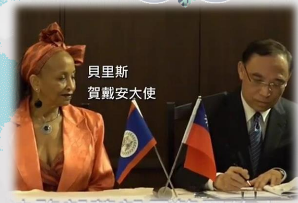
貝里斯 賀戴安大使