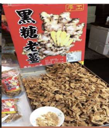
黑糖老薑本人長這樣。