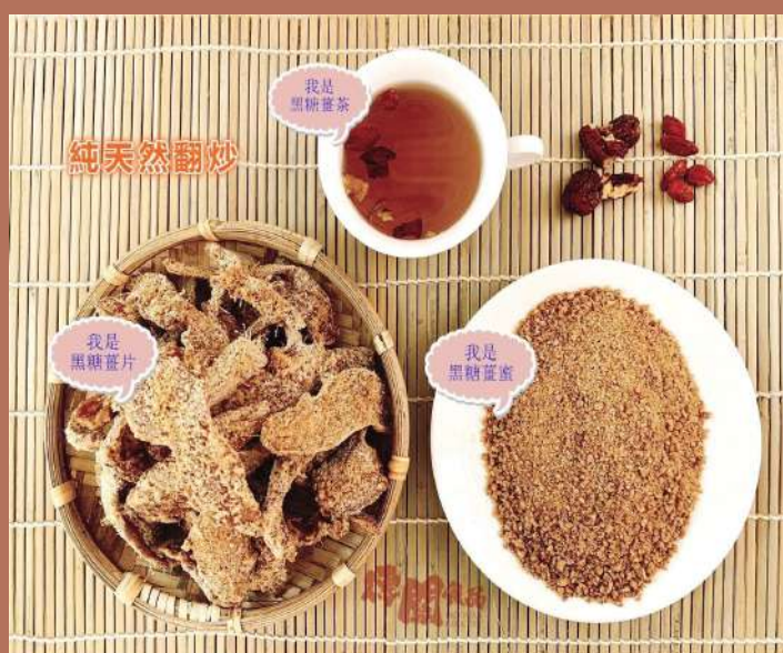
原料只有薑、黑糖，純天然翻炒。

聊天採訪的過程中，閩娘告訴我，每一片黑糖薑片都是她一鍋一鍋手炒出來的，為了讓黑糖與薑片不結塊，要不斷翻炒 2 至 3 小時，還必須趕在冷卻之前將薑一片片撥開，否則黑糖與薑片便會決定從此「團結在一起，永久不分離」，那麼整鍋黑糖薑片也就只能以失敗告終（眼角含淚，掰～）。所以一片片完美又漂亮的薑片，必須靠著閩娘「拚力道」以及「拚速度」的奧運精神，才能完成這一包包冬日必備的黑糖薑片。