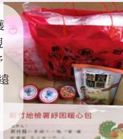
新竹地檢署紓困暖心包

竹檢在防疫三級警戒期間，為提供偏遠鄉鎮受保護管束人基本生活物資，乃結合在新竹市經營南北貨的觀護個案及更保新竹分會，將日常生活所需之物資組成紓困暖心包，自5日陸續分多次寄出，提供予居住於新偏遠山區之生活困頓觀護個案。