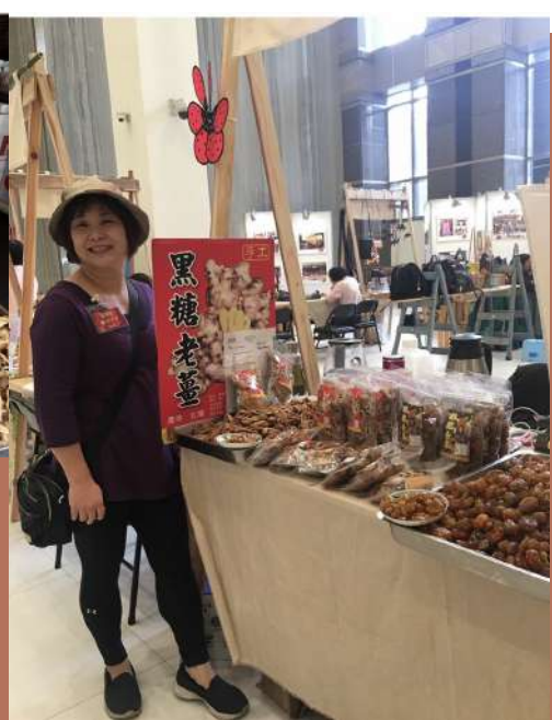
閩娘本人是不是很美～

記得去年冬天飲用時，覺得這杯薑茶的薑香氣特別濃郁，且泡完的薑片能夠直接食用，對容易虛寒的女孩子而言正好暖宮去濕寒。提到這點，閩娘說因為她特別挑選南投山區的薑，水分低，香氣自然濃郁，黑糖也是使用新竹的寶山黑糖，用心挑選的食材以及精心的製作方式，讓閩娘的黑糖薑茶喝起來薑香氣濃郁搭配黑糖香氣，冬天來一杯，我真的感受到什麼叫「樸實無華的幸福」。有趣的是，閩娘特別交代我，一定要特別註明他們家的產品「會壞！」（對！你沒看錯，就是會壞，閩娘還叫我一定要寫，沒寫要扣我分數）（嚇？！）因為沒有添加防腐劑以及色素，所以產品會變質也不能久放，請在最佳賞味期限內，盡快飲用完畢。所以答應我，買了就乖乖的盡快飲用完畢，不要調皮地買了久放又不喝，好嗎，嗯？