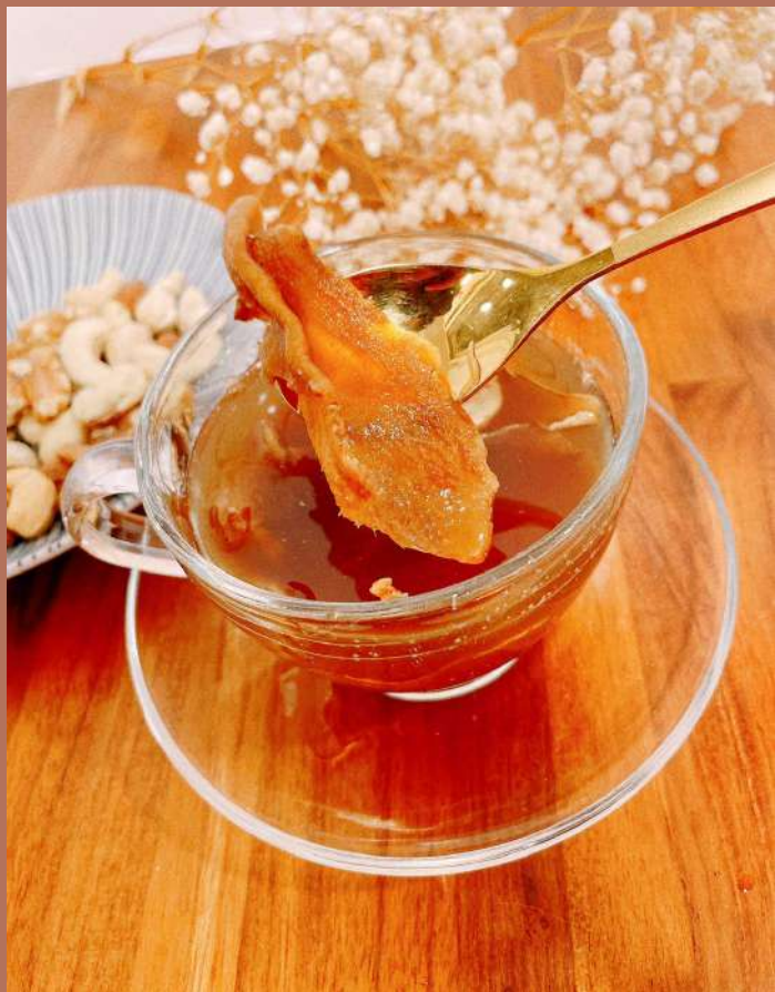
冬天來一杯暖心薑茶，暖身暖心也暖宮。

去年冬天某一天，寒流來襲，冷到要命，才剛進辦公室，同事就丟一包黑糖老薑在我桌上還說：「拿去，賞你的」（謝主隆恩～），下午準備泡來喝時，才發現這包黑糖老薑似乎跟過去所喝的黑糖老薑不大一樣，一片片的薑片外裹上一層糖霜，我還想說：「不是阿～所以黑糖本人是還在後台休息室不肯出來嗎？阿黑糖人咧？」正當我疑惑的沖泡熱水時，哇塞！黑糖本人立刻華麗現身耶～透過了熱水的沖泡攪拌，外層的糖便會轉變為一般我們所看到的黑糖薑茶的顏色，原來外面那一層糖就是黑糖本人啊。大概是我書讀得不多又淺見寡聞，第一次看到這樣的黑糖老薑茶，覺得神奇且驚喜，這次因為電子報終於有機會採訪到閩娘本人時，我簡直興奮到模糊，世紀之謎終於要解開了呀～（對～我鋪眼鋪這麼久，終於要進入採訪正題了呀比）。