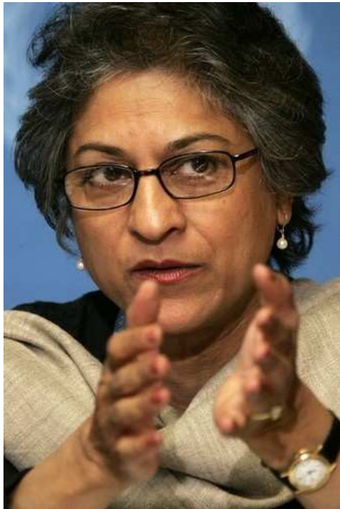
Ms Asma Jahangir

尊重，保護及落實人權 Respect, Protect and Fulfill Human Rights