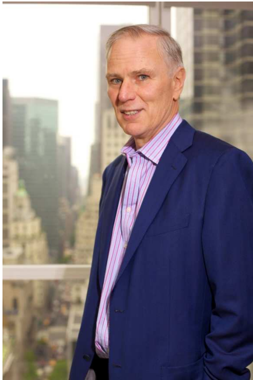
Professor Philip G. Alston

尊重，保護及落實人權 Respect, Protect and Fulfill Human Rights