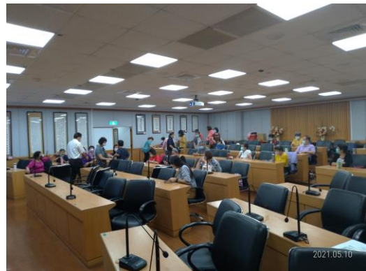
志工交流互動情形。