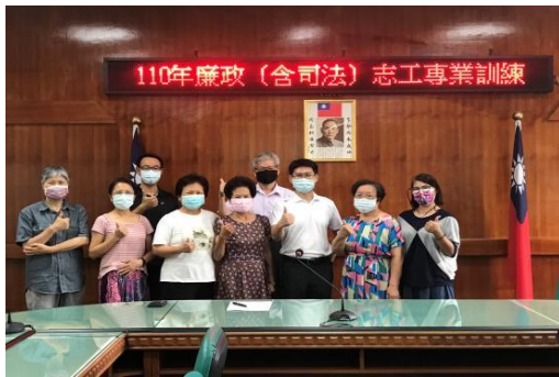
全體廉政(司法)志工合影。