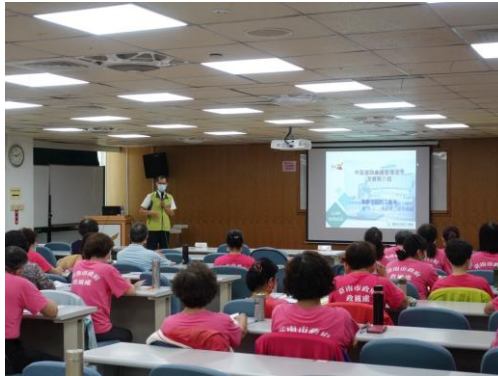
臺南市政府工務局副總工程司講授情形。

藉由該署政風室、臺南市政府政風處及臺灣臺南地方法院政風室座談會時機，進行志工服務意見交流，透過聯繫、溝通、傾聽與經驗交流，增進彼此互動情誼。