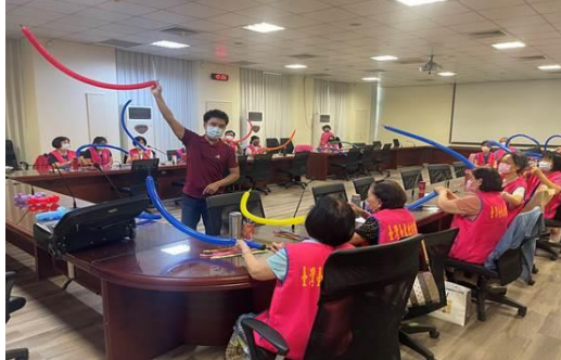
志工學習造型氣球摺法。

由該署書記官長、政風室主任及研考科長與志工夥伴進行意見交流及凝聚團隊共識，提升為民服務品質。