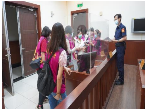
廉政志工聯誼與參訪活動。