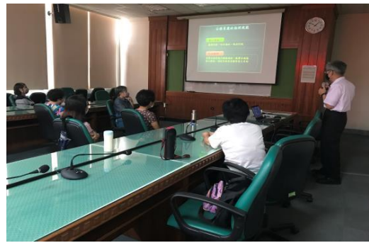
政風室主任講解廉政倫理規範。