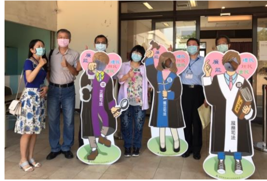
彰、雲、嘉縣市政風處長官合影。