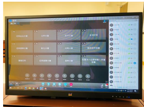
各地犯保分會視訊上課情形。