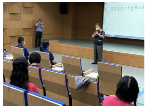
志工分享服務經驗。