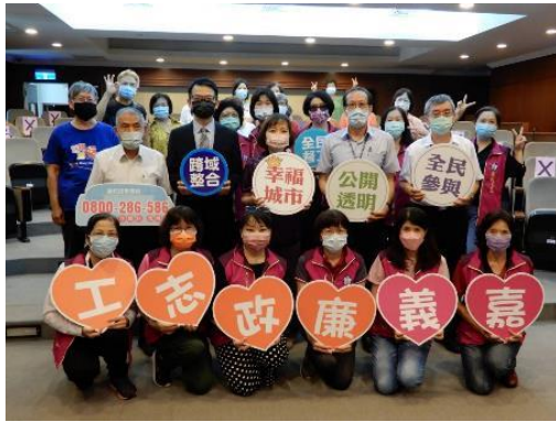
檢察長與全體廉政志(義)工合影留念。

否有進一步瞭解」及「對反貪污及廉政相關法令規範的瞭解程度是否有增進」全數受訪者均表示增加許多知識，有效達到培訓專業知能及凝聚貪腐零容忍共識之目的。