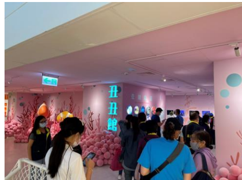
企業參訪交流活動。